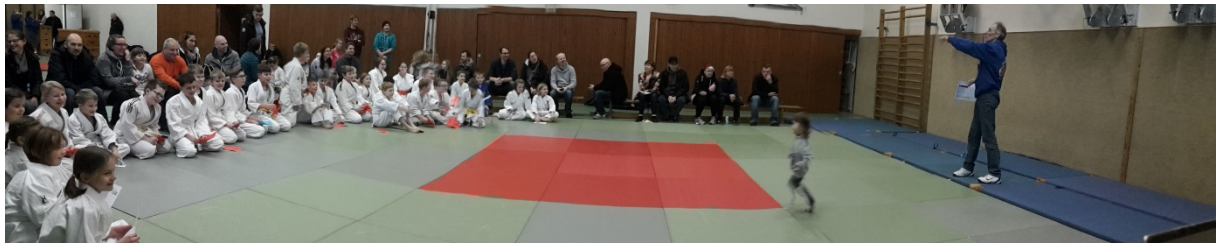
360° Blick bei der Begrüßung