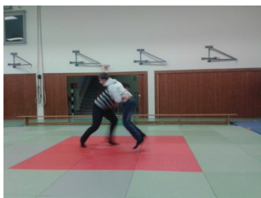
Vorbereitung der Judosafari