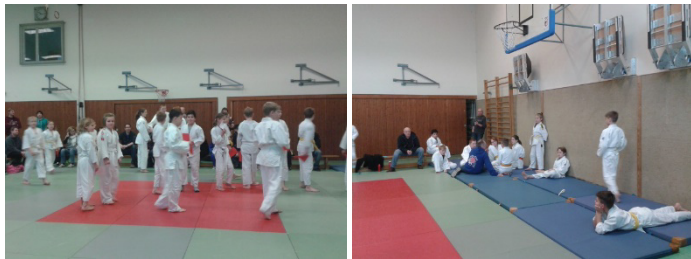
Judoka auf der Matte